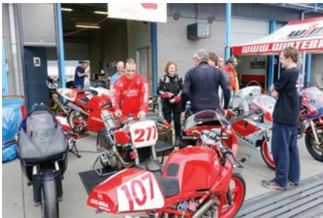
Gilera-Fahrer aus vier Ländern trafen sich in Assen.

Für den Freitag hatte ich mich für die Freien Trainings angemeldet. Vorher noch den Transponder bei der Rennleitung abgeholt. Ohne den darf niemand auf die