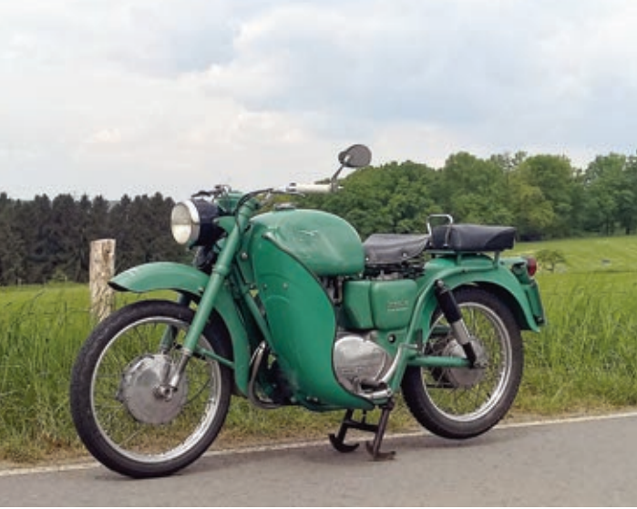
Die grün lackierte Lodola war bei der Forstpolizei von Salerno im Einsatz.

Motorrad, und es wurde beim nächsten Transport geliefert.