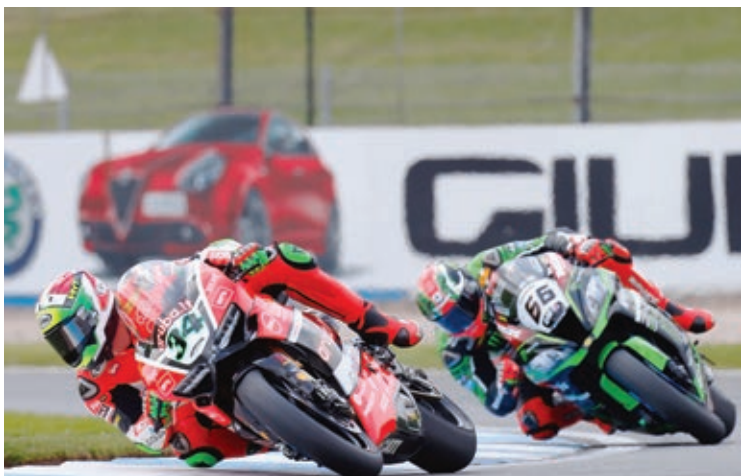
Lange führte Davide Giugliano (34, Ducati) vor Tom Sykes (66, Kawasaki).

Bald überholte Rea Savadori, aber bei der großen Lücke hatte er keine Chance mehr, das Führungsduo einzuholen. Davies arbeitete sich nach seinem Sturz bis auf den neunten Rang vor. Dann ging der Ducati-Werksfahrer ein zweites Mal zu Boden und mußte das Rennen beenden.