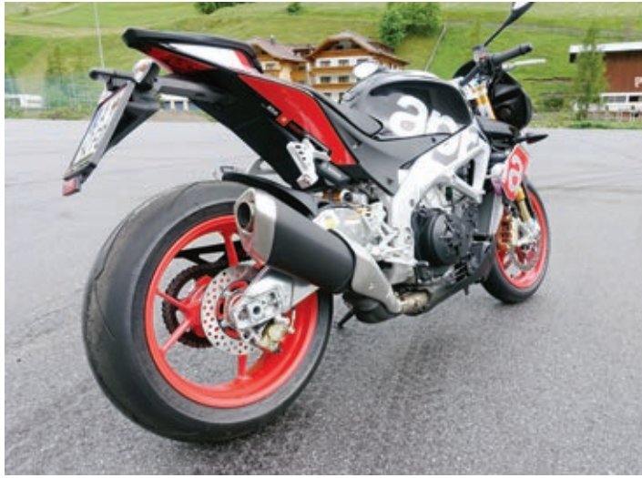
Die Tuono macht mächtig Sound - Donnerbike.

Hohe Drehzahlen sind nicht nötig, das Motorrad kann auch schaltfaul gefahren werden. Jederzeit reicht ein kurzer Dreh am Gasgriff, und die Tuono springt wie eine Raubkatze nach vorne. Die wilden Pferde warten nur darauf, losgaloppieren zu dürfen. Das schiebt vehement nach vorne und will einfach nicht mehr aufhören. Bei 7.000 U/min legt der V4 dann nochmal kräftig zu, daß es einem das Grinsen ins Gesicht treibt. Bei Vollgas ohne die Kupplung zu ziehen die Gänge durchladen, und dann muß man schon wieder abbremesen, weil die nächste Kurve auf einen zuspringt. Ein kräftiger Dreh am rechten Griff reicht auch noch im dritten Gang aus, um unabsichtlich das Vorderrad zu lupfen. Um dieses zu verhindern, verfügt die Tuono über eine dreistufige Wheeliekontrolle, die so ausgezeichnet funktioniert, daß man immer mal wieder gerne das Vorderrad lupft, damit die Elektronik es sanft auf den Boden zurückbringt.