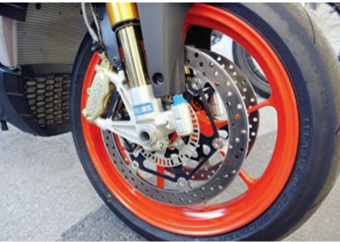
Öhlins-Gabel, Brembo-Monoblock M4 32 und knallrote Räder gehören zur Factory-Variante der Tuono.

destärken. Aber wichtiger ist, daß die Tuono im mittleren Drehzahlbereich um bis zu 20 PS zugelegt hat, und das merkt man. Das Drehmoment stieg gleichzeitig von 113 auf 121 Nm.