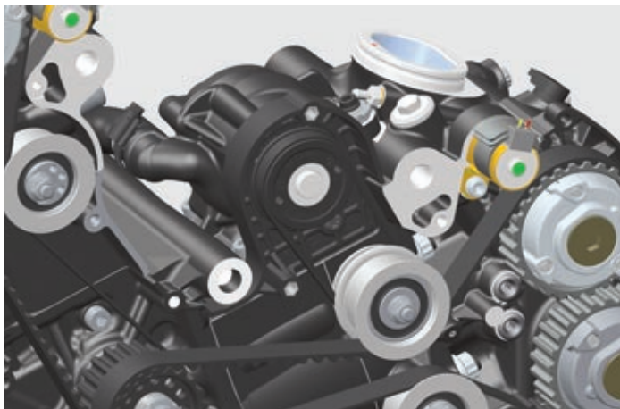
Die Wasserpumpe sitzt nun auf dem liegenden Zylinder. Der Antrieb erfolgt von einer Spannrolle des Ventiltriebs über einen kleinen Riemen.

ter verlängert. Dazu erhielt der Motor die variable Ventilsteuerung, wie sie bereits in der neuen Multistrada zu finden ist. Die deshalb neuen Zylinderköpfe sind mit dem kleinen Frontrahmen verschraubt, der Motor dient als tragendes Teil.