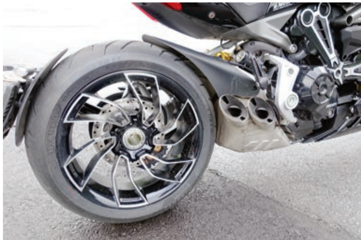
Für die XDiavel S wurde mal wieder ein neues Felgendesign entworfen.

Das TFT-Display ist besser als bei der aktuellen Monster abzulesen aber nicht so gut wie das Cockpit der Multistrada.