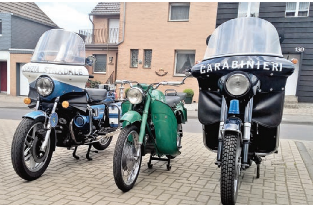
Drei ehemalige Moto Guzzi-Behördenmotorräder aus Italien. Zwischen der T3 und der Falcone wirkt die Lodola zierlich.

Einige Tage nachdem der Transport unterwegs war, fand ich die Annonce einer Nuovo Falcone der Carabinieri von 1970 mit nur 5.400 Kilometern Laufleistung. Ich rief Vincenzo an, der das Motorrad für mich besichtigte. Nach einigen Tagen beschrieb er mir die Falcone am Telefon, und ich war begeistert. Der Preis paßte ebenfalls. Da ich mich auf Vincenzo verlassen kann, weil er selbst sehr viel Erfahrung mit Guzzis hat, kaufte ich das