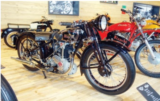
Links: Bianchi 250 Freccia Oro von 1939 mit Handschaltung, obenliegender Nockenwelle und offenen Ventilsfedern.