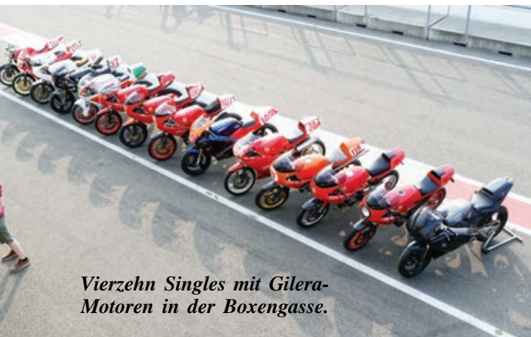
Vierzehn Singles mit Gilera-Motoren in der Boxengasse.

Zusammen mit Pim, der eine Reihe vor mir stand, bog ich in die erste Kurve ein. Vor der Schikane am Ende der Gegengerade konnte ich ihn ausbremsen. Ich rechnete jedoch mit einem Konter von Pim, immerhin war er im Training deutlich schneller als ich gewesen. Aber er