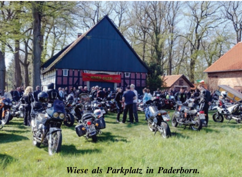
Wiese als Parkplatz in Paderborn.

Also erstmal ein Kaffee und ein Brötchen, und dann umschauen. Hier und dort traf man Bekannte, die man den langen Winter über nicht gesehen hatte, und es gab wie immer einige interessante Motorräder zu bestaunen. Der nächstgelegene Moto Guzzi-Händler hatte eine neue V85 TT zur Verfügung gestellt, die hier ausgiebig bewundert und probegesehen wurde. Rund um die Maschine und andere Themen gab es reichlich Benzingsprache.