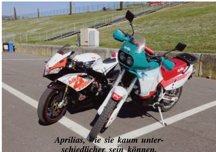
Aprilias, wo sie kaum unterschiedlicher sein können.

Bei Aprilia war man von dem Erfolg der Veranstaltung anscheinend äußerst angetan und kündigte eine Wiederholung für das Jahr 2020 an.