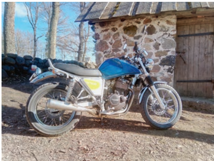
Unverschnörkelter Einzylinder, der zeitweise, auch jetzt noch, sehr günstig angeboten wird.

hierbei leckere Blechnahrung gefunden haben.