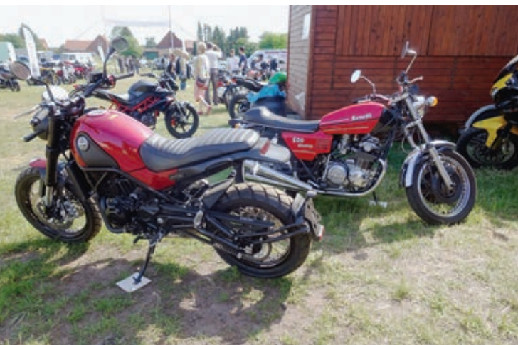
Zwei 500er-Benellis: rechts eine vierzylindrige 500 Quattro aus den Siebzigern und links eine aktuelle Leoncino mit zwei Zylindern.

So waren beim Benelli-Treffen auf dem eigenen Gelände auch Kennzeichen aus diversen Ländern zu entdecken. Die meisten Teilnehmer kamen aber erwartungsgemäß aus Deutschland, und der Schwerpunkt lag eher bei