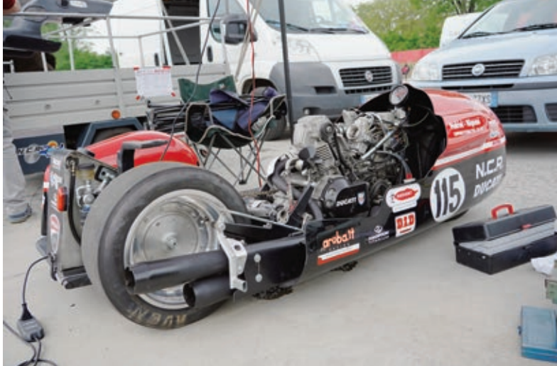
Das Ducati-Gespann entblättert im Fahrerlager.

Der Ton macht die Musik und nicht die Säusel-Motorräder mit E-Antrieb, die in einer italienischen Gruppe mitgefahren sind und von denen man nichts hört und sie erst bemerkt, wenn sie vorbei sind. Für