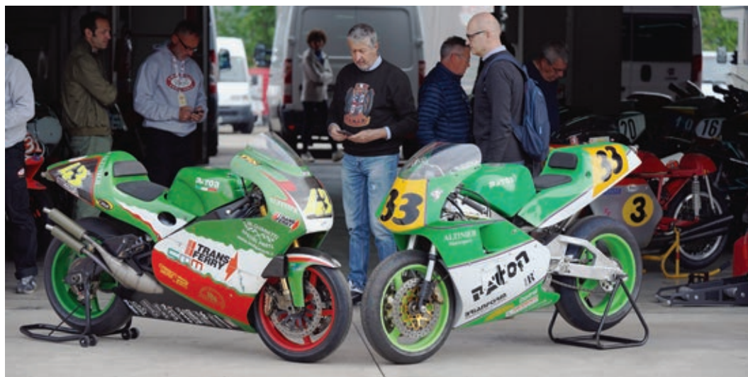
Die Paton-Rennmaschinen mit den Zweizylinder-Viertaktmotoren sind recht bekannt. Eher unbekannt sind die 500er-Vierzylinder mit Zweitaktmotoren.