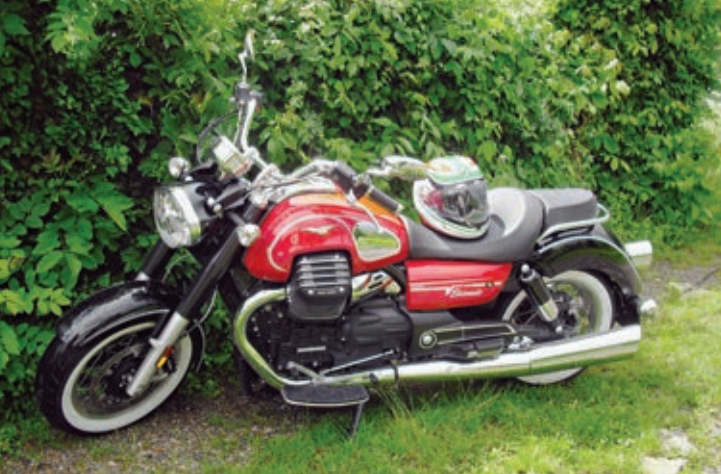
Eine weitere Guzzi mit dem 1.400er-Motor ist die Eldorado, sozusagen eine abgespeckte Version der California 1400.

Zum Verschließen ist ein zweiter Schlüssel neben dem Zündschlüssel nötig. Und am Schlüsselring baumelt serienmäßig eine kleine Fernbedienung für die Alarmanlage, die zur umfangreichen Ausstattung gehört. Da merkt man der Cali ein wenig an, daß sie doch schon seit sieben Jahren auf dem Markt ist. Aber sie verfügt bereits über Ride-by-Wire mit drei verschiedenen Leistungskennfeldern, Traktionskontrolle, Warnblinkanlage, Tempomat, Ganganzeige und Winkelventile in beiden Rädern.