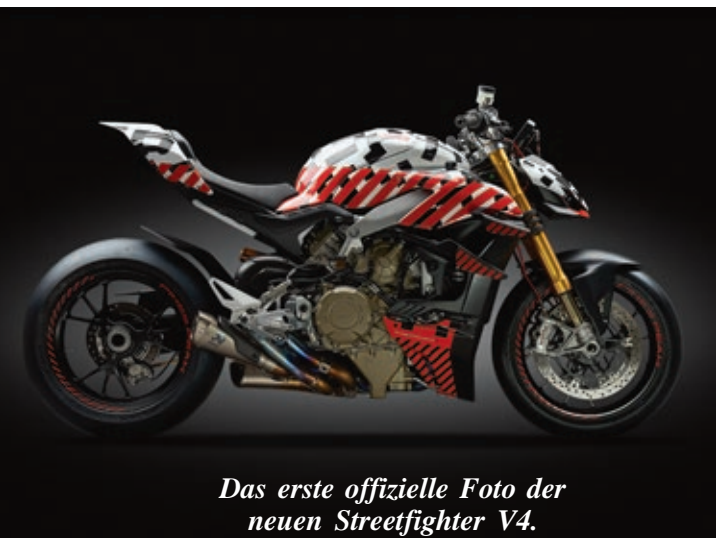
Das erste offizielle Foto der neuen Streetfighter V4.

Die beiden neuen Ducati-Modelle werden voraussichtlich im November auf der EICMA in Mailand vorgestellt und sollten zum Saisonanfang 2020 lieferbar sein. Vermutlich wird es, wie bei Ducati üblich, eine Basisversion und jeweils eine besser ausgestattete S- oder R-Variante geben.