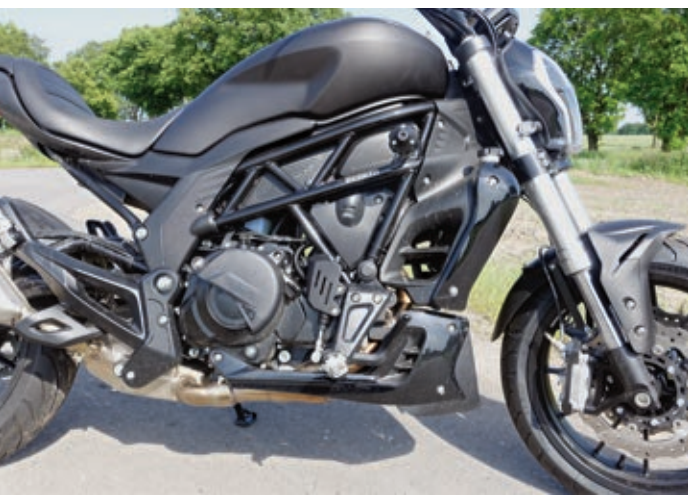
Gitterrohrrahmen und viel Plastik - alles schwarz.

160/60-17. Einen extrem breiten Reifen für die Show vor der Eisdiele konnten sich die Entwickler also glücklicherweise verkneifen und haben eher an ein gutes Fahrverhalten gedacht. Der Radstand ist mit 1.580 Millimetern angegeben.