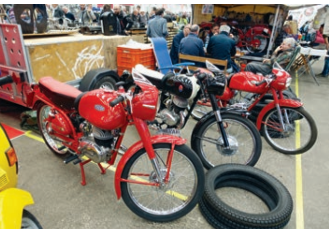
Drei Raritäten mit wohlklingenden Auto-Namen: zwei Ferraris und eine Maserati.

Der Teilemarkt in Reggio Emilia ist so groß, daß man da den ganzen Tag verbringen kann. Teilweise kommen ausländische Gruppen mit einem Reisebus und einem großen LKW angefahren. Hauptsächlich kenne ich das von den Niederländern, die auch diesmal wieder hier waren und fleißig eingekauft haben.