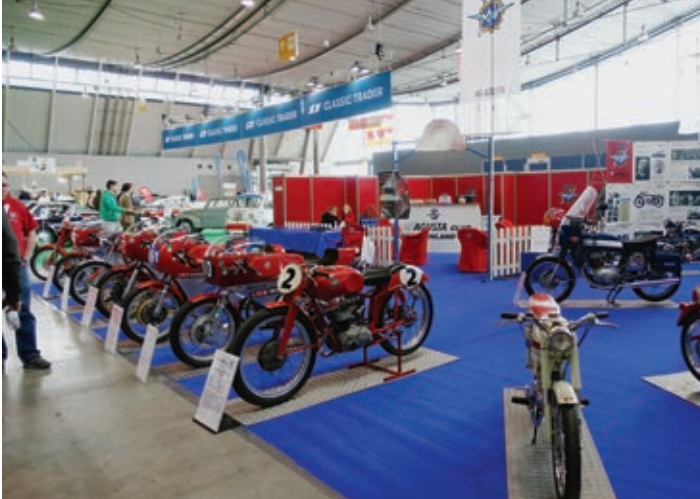
Der MV Agusta Club Deutschland ist Stammgast auf der Retro Classics.

Wer sich neben Motorrädern auch für Autos interessiert, der sollte für die Retro Classics einen ganzen Tag einplanen. Hier gibt es so viele schöne und seltene Autos zu sehen, daß man