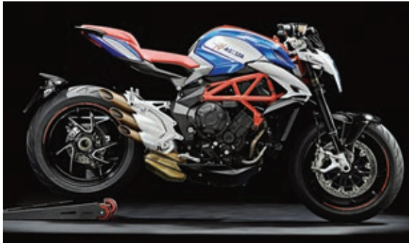
MV Agusta Brutale RR America-Ausführung.

Das Motorrad kostet 18.130 Euro, ist also 2.220 Euro teurer als die normale Brutale 800 RR. Daneben gibt es noch die Varianten Pirelli (19.240 Euro) und Reparto Corse (20.130 Euro).