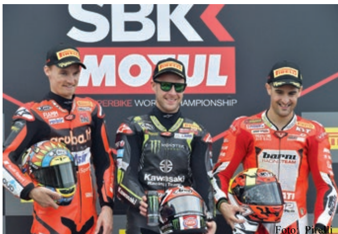
Jonathan Rea (mitte, Kawasaki) gewann vor Chaz Davies (links, Ducati). Xavier Forés (rechts, Ducati) holte den dritten Podestplatz in diesem Jahr.

Nach mehreren Versuchen fuhr Davies auf Platz zwei vor. Dann griff er Rea an, und beide überholten sich mehrfach gegenseitig. In den letzten Runden verlor