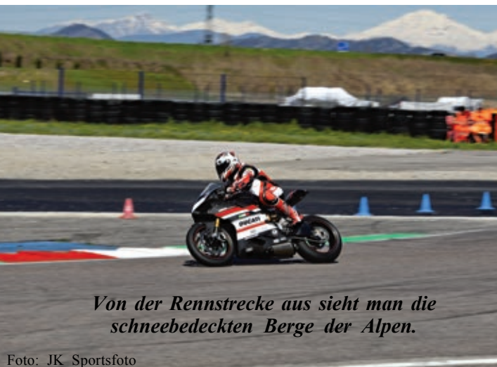
Von der Rennstrecke aus sieht man die schneebedeckten Berge der Alpen.

Den Reschenpaß herunter mußten wir die Bremsen