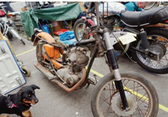
Diese unvollständige, verrostete Ducati 200 sollte ohne Papiere 1.500 Euro kosten. Wer die kaufte, konnte sich hier gleich auf die Suche nach den fehlenden Teilen machen.

leuchtung oder anderes. Das erleichtert die Restauration mit Neuteilen. Dazu gibt es hier so viele Gebrauchtteile, daß man meist fündig wird, wenn man intensiv genug sucht. Kenntnisse der italienischen Sprache sind hilfreich, um nach den begehrten Teilen zu fragen. Und je besser man Italienisch spricht, desto besser kann man meist um den Preis verhandeln und Details zu den Fahrzeugen herausfinden. Was die Preise angeht, muß man meist nachfragen, nur wenige Fahrzeuge sind ausgezeichnet. Und selbstverständlich gibt es für nahezu identische Mopeds oder Motorräder unterschiedliche Preisvor-