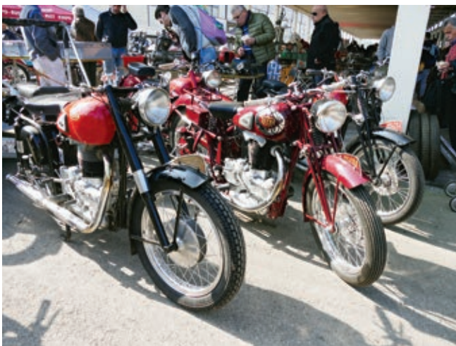
Top restaurierte Gileras aus unterschiedlichen Baujahren erzielen fünfstellende Preise.

manches, was hier zum Verkauf steht, hat jahrelang oder gar Jahrzehnte in Scheunen oder im Freien vor sich hingefristet. Da sind teilweise herausfordernde Restaurationsobjekte dabei, aber gerade solche Aufgaben suchen manche und werden hier auch fündig. Nach dem Kauf eines solchen Objektes kann man sich dann vor Ort gleich auf die Suche nach den nun benötigten Teilen machen. Andere bevorzugen den Kauf komplett restaurierter Fahrzeuge.