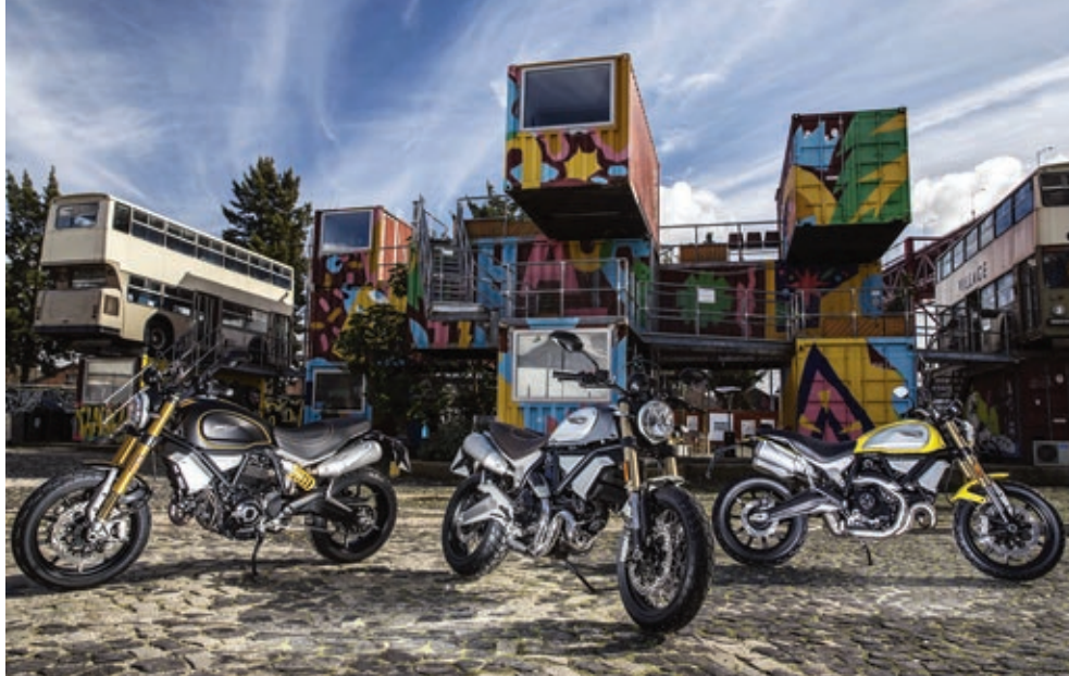
Rechts die normale Scrambler 1100. In der Mitte die Scrambler Special mit Drahtspeichenrädern und verchromter Auspuffanlage und links die Scrambler Sport mit Gabel und Federbein von Öhlins.

Für 14.595 Euro bietet Ducati die Scrambler 1100 Special an. Diese rollt auf Drahtspeichenrädern, besitzt eine Auspuffanlage mit verchromten Rohren und eine gebürstete Hinterradschwinge. Für nochmal 700 Euro mehr steht die Scrambler 1100 Sport beim Händler. Diese unterscheidet sich von dem Basismodell hauptsächlich durch ein Öhlins-Fahrwerk. Ducati gibt für die Basisvariante und die Sport ein