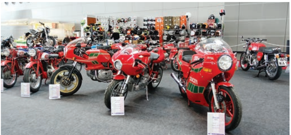
Ducatis Hommage an Mike Hailwood. Links daneben zwei Sertums.

Ebenfalls in anderen Hallen konnte man hier und da ein paar italienische Motorräder entdecken. Die meisten davon standen zum Verkauf. Der Handel mit Oldtimern ist ja neben dem Präsentieren der Kernpunkt dieser Messe. Das Preisniveau war teilweise recht hoch. So sollte eine MV Agusta 750 Sport 139.000 Euro kosten, eine Ducati 900 SS Königswelle war für 36.900 Euro im Angebot. Die meisten Fahrzeuge, die hier offeriert wurden, befanden sich in einem guten bis sehr guten Zustand. Daneben gab es aber auch ein paar Maschinen im durchschnittlichen Alltagszustand mit teilweise recht opti-