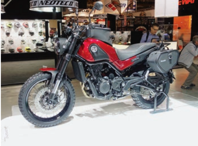
Die Leoncino Trial mit größerem Vorderrad schwimmt auf der Scramblerwelle.

Auch jetzt sind weitere Typen mit dem Namen Leoncino geplant: Es soll eine komplette Baureihe entstehen. Auf der letzten EICMA zeigte Benelli neben der Leoncino 500 die Ausführungen Trial mit Drahtspeichenrädern und Stollenreifen sowie eine Sport, ebenfalls mit Drahtspeichenrädern,