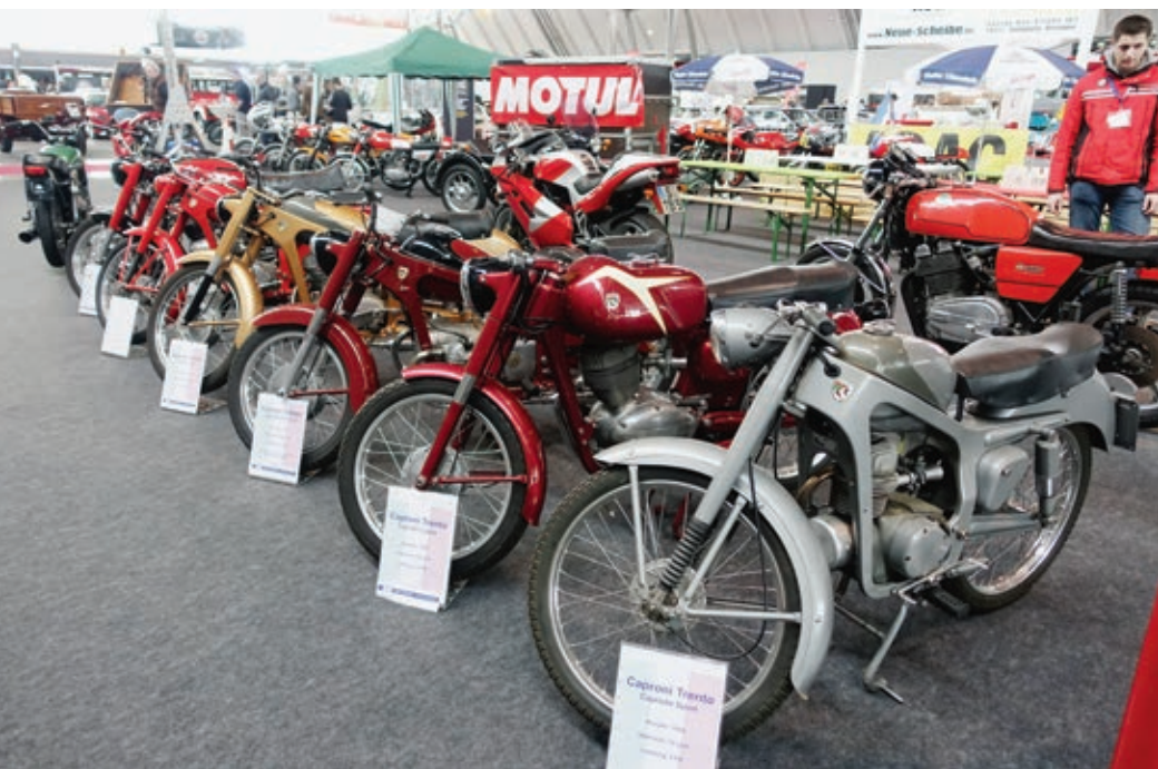
Sechs Capronis in einer Reihe. Ursprünglich baute die Firma Flugzeuge.

Die Männer vom AMSC-Leonberg hatten wirklich keine Mühen gescheut und neben eigenen Maschinen viele Motorräder von Sammlern, Freunden und Bekannten zusammengetragen. Hierbei kamen viele Marken zusammen, die man auf deutschen Straßen nur sehr selten antrifft. So waren neben zwei Aermacchis ein paar Capronis zu bewundern. Ein besonderes Modell ist die Cento 50. Ein Motorrad mit einem Zweizylinder-Boxer-