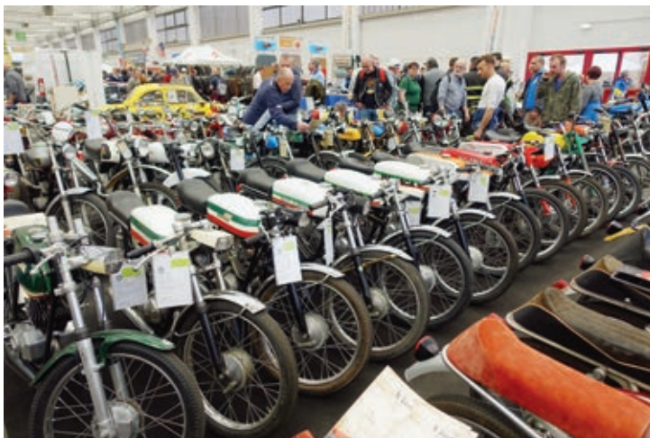
Eine Firma hatte mehr als hundert Gebrauchtmotorräder mitgebracht, die nach Marken sortiert dicht bei dicht standen.

Sehr gut gefiel mir eine Moto Guzzi Motoleggera 65, die anscheinend gerade erst restauriert war und nur 2.000 Euro kosten sollte. Aber auch hier fehlten leider die Papiere. Das macht die Zulassung in