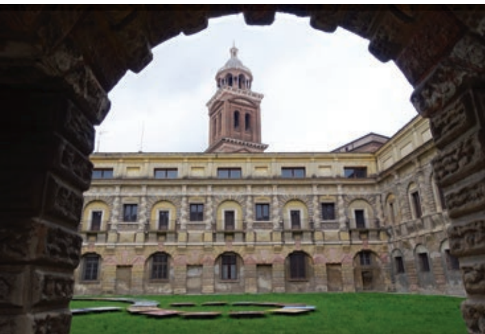
Blick in den Garten des Dogenpalastes von Mantua.

Am Nachmittag des zweiten Tages war Ostern ja vorbei, und wir wählten für unsere Tour auch eine Gegend aus, wo wir weniger