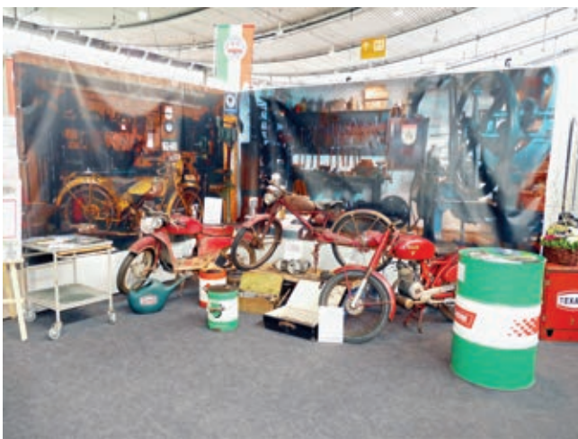
Links: Werkstattszene mit ein paar Restaurationsobjekten.