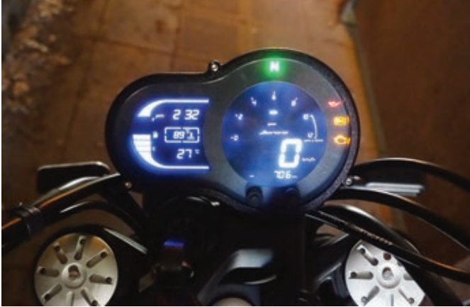
Formschönes LCD-Display mit allen nötigen Informationen.

Gewicht. Doch sie ist fast 2.000 Euro preiswerter als die Ducati.