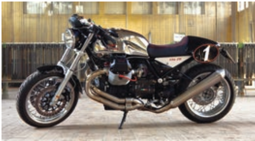
Moto Guzzi und MV Agusta Vertragshändler