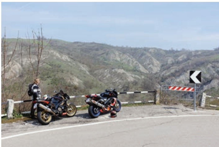
Bestes Wetter beim Abstecher in den Apennin, und das bereits Anfang April.

anderen Tankstellen gibt es zwei unterschiedliche Preise, einmal mit und einmal ohne Bedienung. Der Unterschied macht etwa 15 Cent pro Liter aus. Häufig ist Super Plus nicht erhältlich. In Italien haben manche ENI-Tankstellen (ehemals Agip) Premiumbenzin mit 100 Oktan, aber halt auch nicht alle und manche nur mit Bedienung, was den Preis hoch treibt.