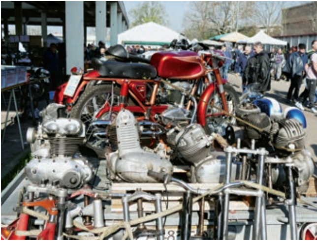
Teile, Motoren und ganze Motorräder, in Reggio Emilia wird alles angeboten.

entfernt, und dieser Mostra Scambio lockt mittlerweile mit mehr als 1.500 Händlern mehr als 30.000 Besucher an. Obwohl der Markt offiziell erst am Samstagmorgen um 8:00 Uhr seine Tore öffnet, kommen die ersten Händler und Käufer bereits am Donnerstag. So manches Motorrad wird da gleich vom Anhänger runter gekauft, und anscheinend kommt man auch schon am Freitag auf das Gelände, wie wir später hörten.