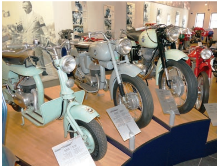
Links der minimalistische Roller Ovunque mit 8-Zoll-Rädern, rechts eine 175 CST mit 19-Zoll-Rädern und dazwischen der Pullman mit 15-Zoll-Rädern.

weiter Weg. Stattdessen produzierte MV Agusta Brot- und Butter-Motorräder und auch Roller, von denen viele in diesem