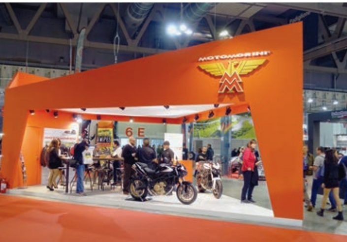
Moto Morini war endlich mal wieder auf der EICMA vertreten und präsentierte das erste Modell mit ABS und Euro 4. Dafür fehlte diesmal Bimota.

Bei Moto Guzzi wurde ja im Vorfeld lange spekuliert, ob die V7-Modelle nun von V9-Typen abgelöst werden oder ob Guzzi die traditionsreiche Bezeichnung V7 und den kleineren Hubraum beibehält. Auf der EICMA feierte Guzzi dann das 50-jährige Jubiläum der V7 mit einer Anniversario und ließ