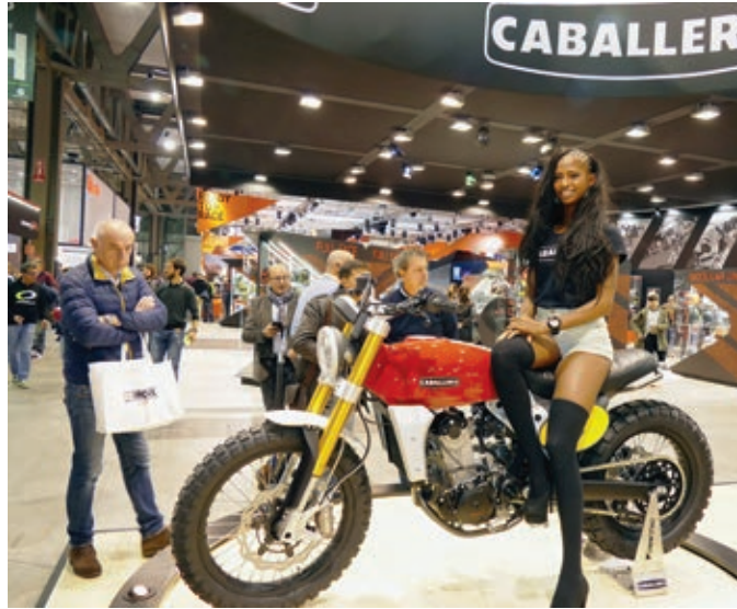
Fantic 500 Caballero als Scrambler mit 43 PS.

Fantic zeigte zwei Modell-Varianten auf der EICMA, eine in Richtung Scrambler gehende Maschine mit einem 19-Zoll-Vorderrad und Stollenbereifung sowie einen Street Tracker mit 17-Zoll-Vorderrad und nicht so grobem