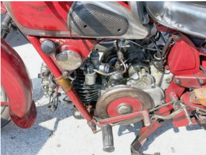
Typisch für die alten Moto Guzzis ist die aufliegende Schwungscheibe.

Auch wurde immer brava anno per anno von alle mariti meine alimenti bezahlt. All die alten documenti di assicurazione sind die Beweis. Der tedesco kriecht immer tiefer in die documenti, dabei scheint er so langsam Gefallen an mir zu fin-