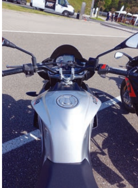
Halbhoher Rohrlenker an der Tuono 125.

bremsen. Dazu Gußräder, Cockpit mit Digitalanzeige und ABS mit Überschlagerkennung. Wie schon geschrieben, wirkt das ABS ausschließlich auf das Vorderrad, aber ein blockierendes Hinterrad ist ja in den meisten Fällen noch gut beherrschbar. Das Bosch-Antiblockiersystem ist nicht zu scharf abgestimmt und greift sanft ein.