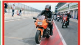
Schnupperrunden auf der Strecke