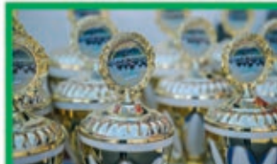
Preise und Pokale für die Schönsten