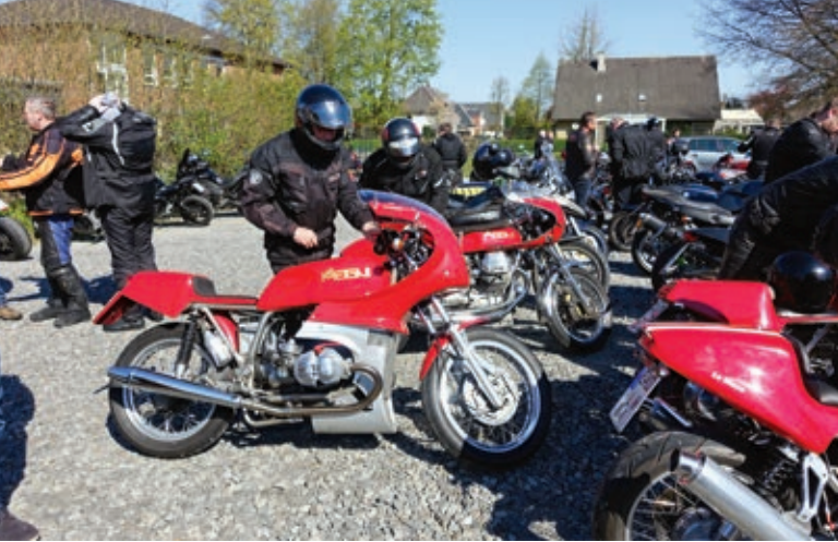
Vorne eine Magni-BMW, dahinter eine Magni-Guzzi. Die Magni-BMW vereint einen Boxer-Motor mit italienischen Rahmen - also das ideale Motor- rad für dieses Boxer- und Italo-Frühstück.

legt. Es kamen einfach immer mehr und mehr Motorräder zusammen. Darunter auch einige, welche weder aus Italien kamen, noch über einen Boxer-Motor verfügten, aber was soll's. Unter den Maschinen gab es einige Raritäten zu sehen. Die Marke Magni ist traditionell in Visbek stark vertreten, und eine Hercules Wankel bekommt man hier auch meistens zu sehen. Dazu gab es noch andere Exoten zu bestaunen wie eine Ghezzi-Brian oder ein Ducati Paso-Gespann mit Armec Tremola-Seitenwagen, dazu schön-