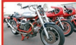
Italo-Treffen und Frühstück