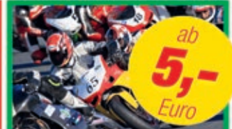
Italo Rennaction live

Mit Paddock Parkplatz • Edelbike Premiere • Italo Live Musica • Spaghetti Buffet