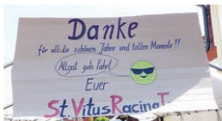
Abschiedsgruß des Veranstalterteams.

Und es wurden jede Minute immer mehr. Schnell reichte der Platz in der Straße nicht mehr aus und auch die Seitenstraßen wurden genauso wie der Parkplatz vor dem Rathaus von den Bikern be-