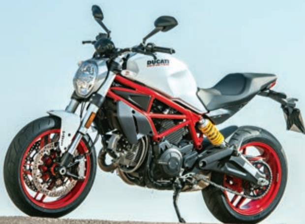
Auch in weiß mit rotem Rahmen lieferbar.

dem selbstverständlich sein. Außerdem ist bei beiden Modellen der Tank aus Stahl gefertigt. Ein Aufkleber weist darauf hin, daß die Motorräder auch E10-Treibstoff vertragen. Früher waren die Ducatis mit der desmodromischen Ventilsteuerung recht wartungsintensiv. Das ist heute kein Thema mehr. Die Ventile müssen nur noch alle 30.000 Kilometer eingestellt werden, und der kleine Service ist nach 15.000 Kilometern fällig. Früher waren die Monster und die Super-