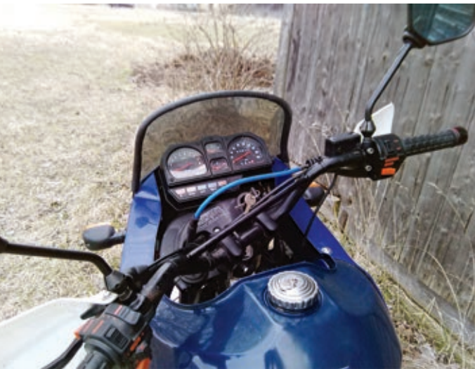
Das Cockpit der Aprilia 6.35 Tuareg Wind ist für damalige Zeiten mit vier analogen Instrumenten gut ausgestattet.

jegliche Aussetzer oder sonstige Kapriolen. So als wenn es keine Standzeit gegeben hätte. Laut Vorbesitzer läuft der Motor mit der Iridiumkerze deutlich runder und springt auch besser an. Den Tip gebe ich gerne weiter.